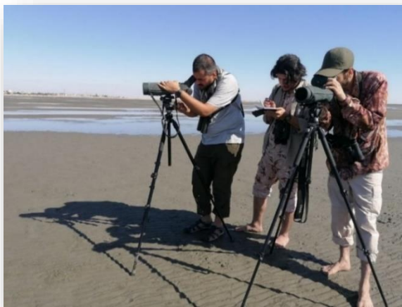
پرنده‌نگری به کمک ابزار مختلف. ۸

مهم‌ترین ابزار پرنده‌نگری دوربین دوچشمی است که انواع مختلف آن از ارزان‌قیمت‌ترین تا دوربین‌های گران‌قیمت در بازار موجود است. از دیگر ابزارها می‌توان به SCOPE پرنده‌نگری (تلسکوپ‌های مخصوص) اشاره کرد که بیشترین کاربرد آن برای پرنده‌نگری در حاشیه تالاب‌ها است. پرندگان آبی و کنارآبی موجود در تالاب‌ها به‌شدت به حضور انسان واکنش نشان می‌دهند. از سوی دیگر، نزدیک شدن به پرندگان به دلیل گلی بودن زمین و سختی حرکت در آن، مشقات خاص خود را دارد. به همین دلیل از تلسکوپ‌هایی با برد بالا استفاده می‌کنند تا بتوانند به راحتی پرندگان را مشاهده کنند. ۷